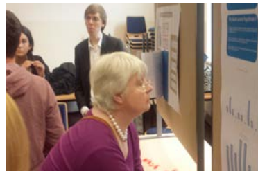
erste Ergebnispräsentation

Im vorigen Newsletter berichteten wir von unserer Kooperation mit dem Projektbüro Angewandte Sozialforschung der Uni Hamburg: Eine studentische Gruppe wollte herausfinden, ob die Angebote von MARTINierLEBEN dazu führen, dass SeniorInnen sich weniger isoliert fühlen, die zweite, inwiefern junge Familien an einem Mehrgenerationenangebot generell interessiert sind. Erste Ergebnisse liegen nun vor: